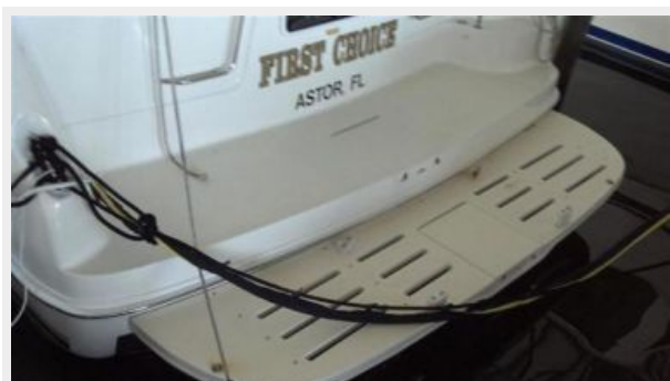
Extended Swim Platform