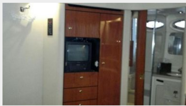
VIP SR TV