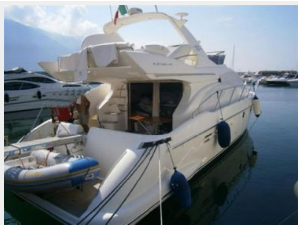
Az 50 Seven