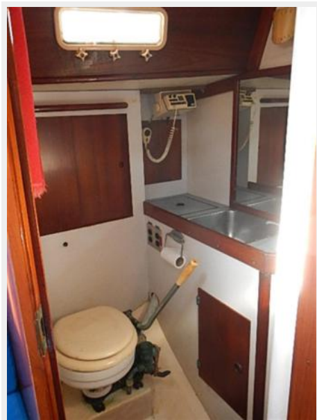
38' Le Comte Northeast head