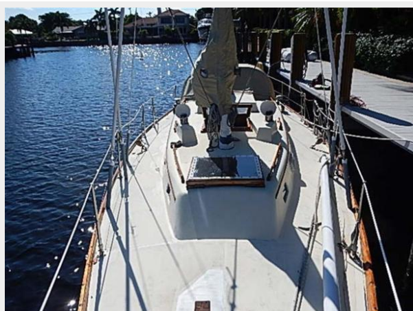
38' Le Comte Northeast foredeck aft