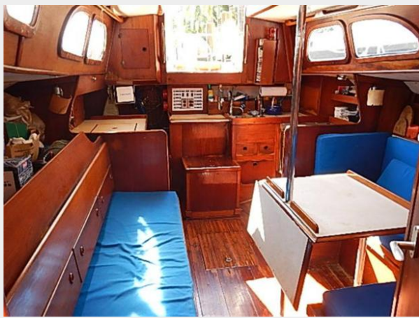
38' Le Comte Northeast salon aft