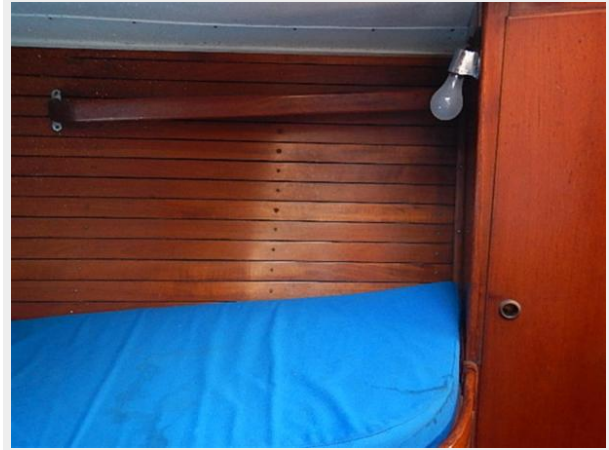
38' Le Comte Northeast stateroom starboard