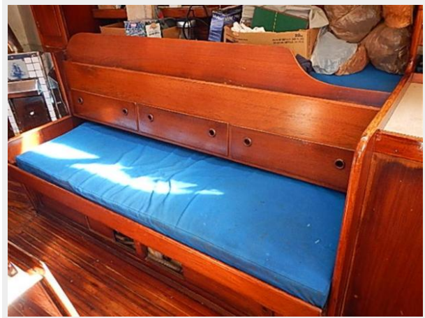
38' Le Comte Northeast salon seating