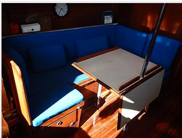
38' Le Comte Northeast salon settee