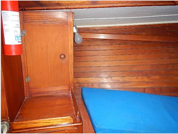
38' Le Comte Northeast stateroom port