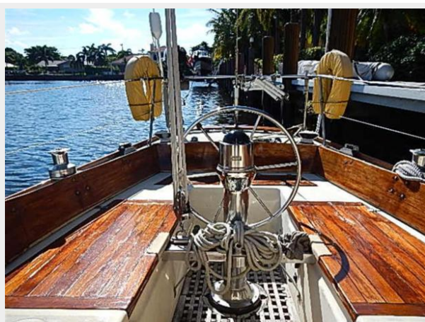
38' Le Comte Northeast cockpit aft