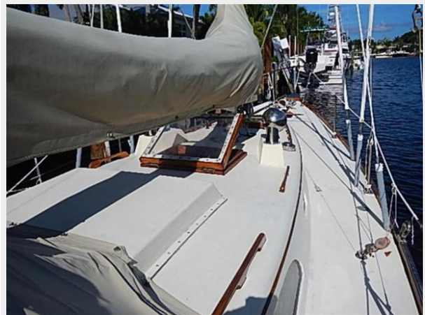
38' Le Comte Northeast foredeck