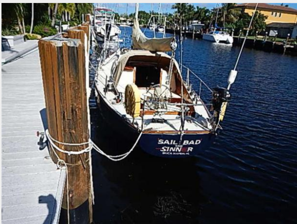
38' Le Comte Northeast aft profile