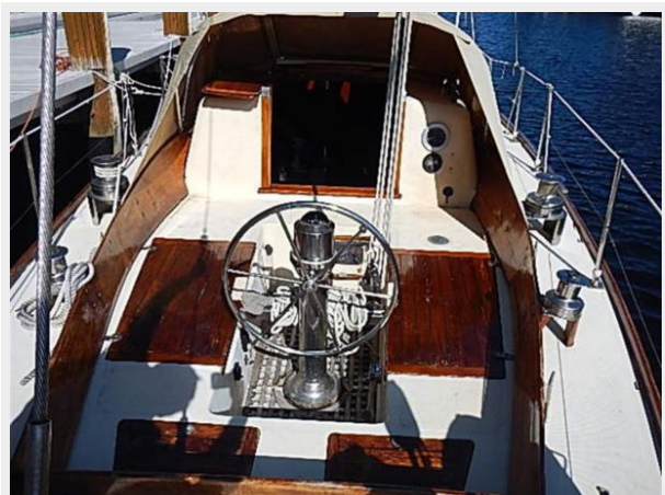
38' Le Comte Northeast cockpit forward