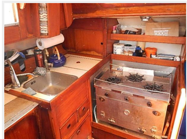
38' Le Comte Northeast galley