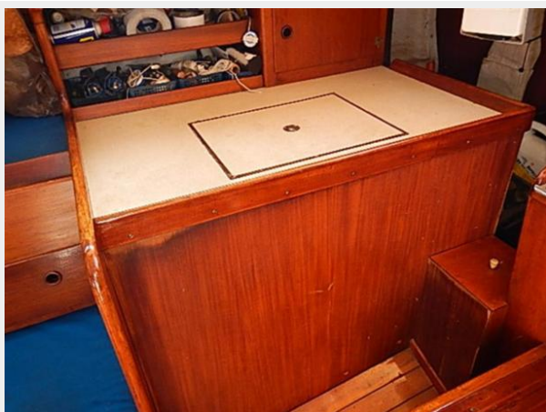
38' Le Comte Northeast refrigeration