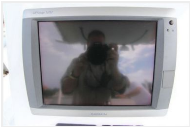
Garmin 5212 Plotter/Sounder