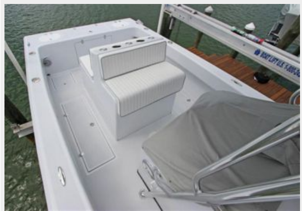
Engine Cover W/Integrated Helm Seating