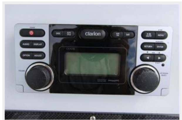
Clarion CMD8 Marine Stereo