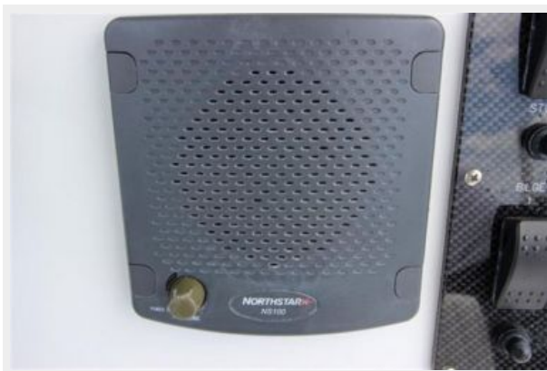
Northstar VHF Marine Radio