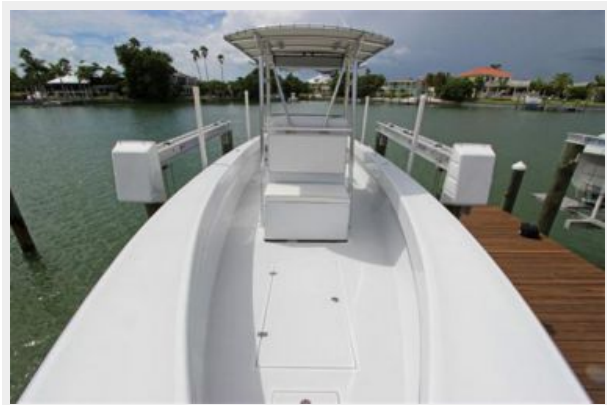
Large Cockpit Looking Aft