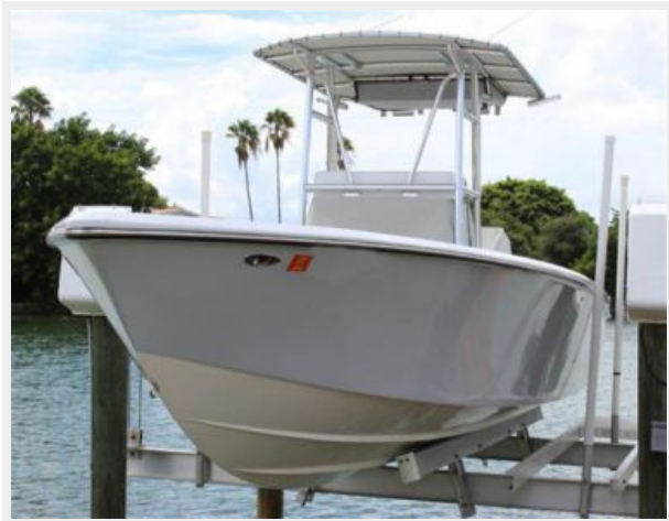
Hull Sides Painted in Grey Awlgrip