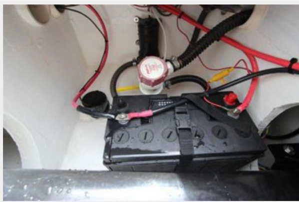
Port Side Battery Compartment