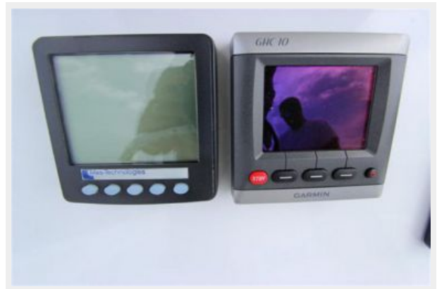
Mas-Technologies Digital Engine Instrumentation & Garmin GHC 10 Autopilot