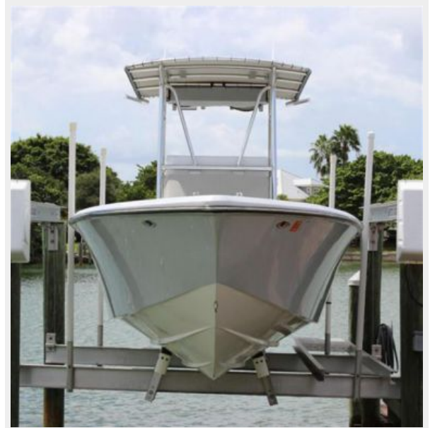
No Bottom Paint