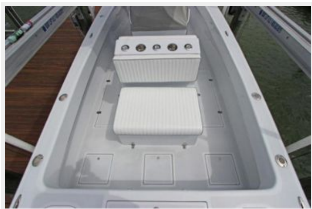
Rear Facing Seating On Engine Cover