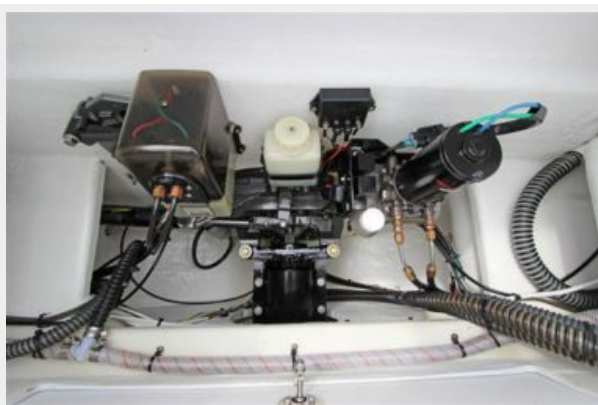
Aft Rigging Compartment