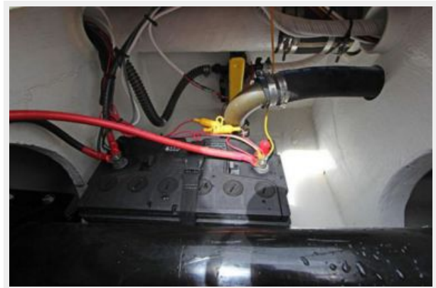
Starboard Side Battery Compartment