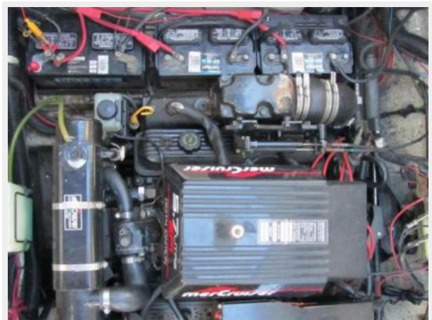
33' Rinker 3300 Fiesta Vee Port engine 5.7 EFI's