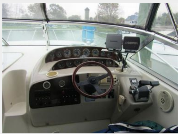
33' Rinker 3300 Fiesta Vee Forward helm view