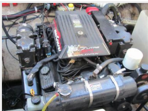
33' Rinker 3300 Fiesta Vee STBD engine Mercruiser