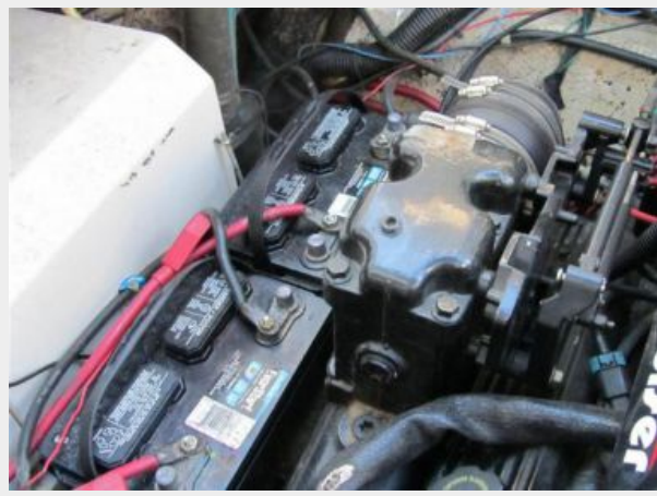
33' Rinker 3300 Fiesta Vee Battery bank