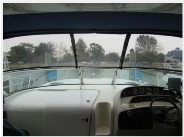
33' Rinker 3300 Fiesta Vee Dashboard and helm area