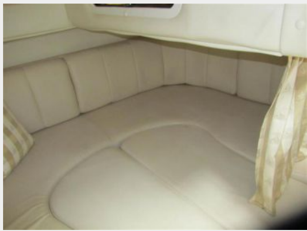
33' Rinker 3300 Fiesta Vee Mid-cabin stateroom