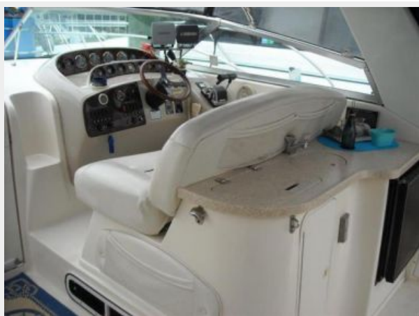
33' Rinker 3300 Fiesta Vee Helm seat w/sink area & ice maker