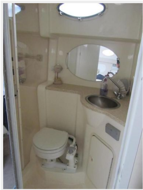
33' Rinker 3300 Fiesta Vee Mid-ship PORT head