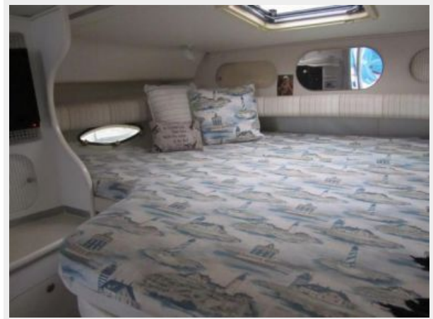
33' Rinker 3300 Fiesta Vee Forward double berth