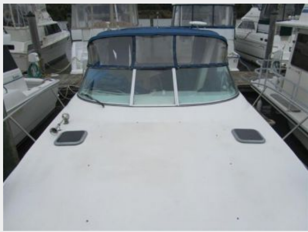
33' Rinker 3300 Fiesta Vee Spacious bow area