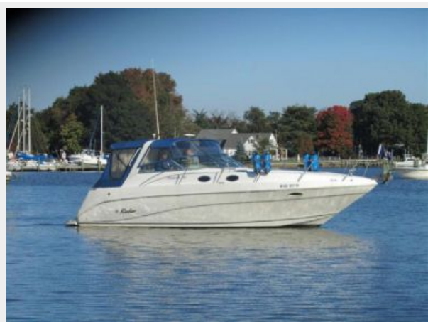
33' Rinker 3300 Fiesta Vee STBD Profile