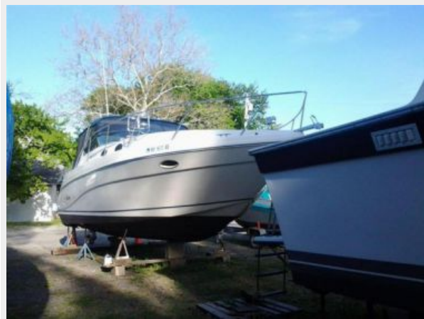
33' Rinker 3300 Fiesta Vee On the hard during winters