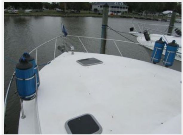
33' Rinker 3300 Fiesta Vee PORT side bow area