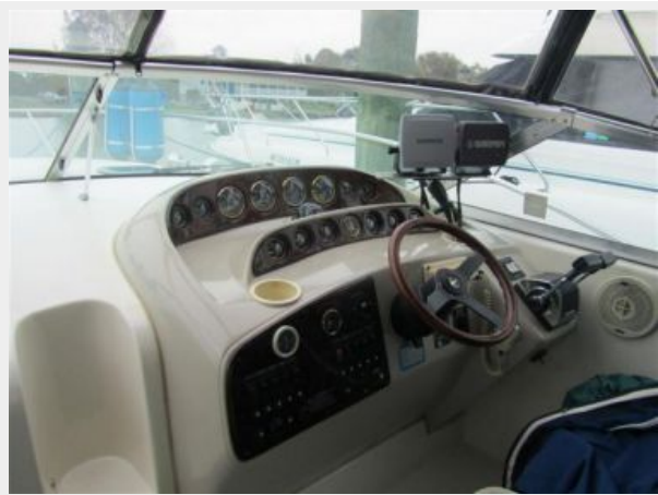
33' Rinker 3300 Fiesta Vee Side helm view