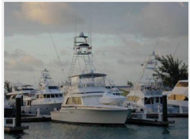
At Dock in Bahamas