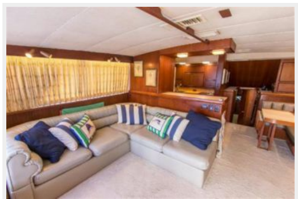
CUSTOM SALON DOOR