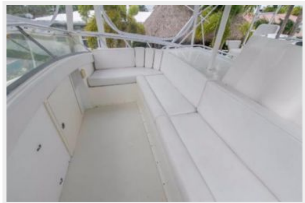
FORWARD HELM SEATING - New isinglass enclosure.