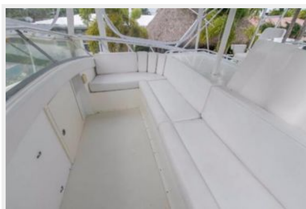
FORWARD HELM SEATING - New isinglass enclosure.