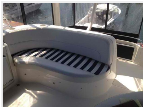
Bridge Seating 3