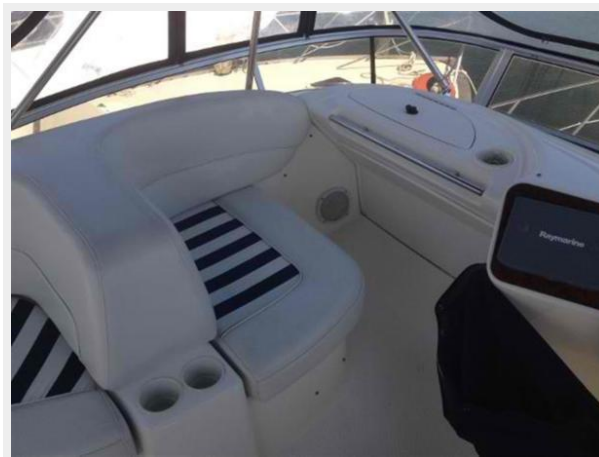
Bridge Seating 2