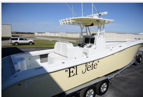
Side View Looking At Console