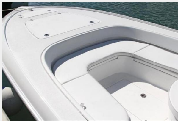
25 Bay forward seating and casting deck