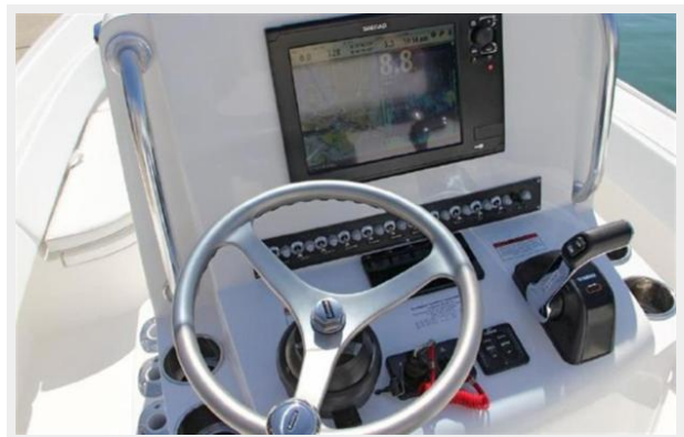
25 Bay large console