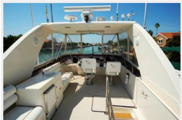
Bridge looking FWD