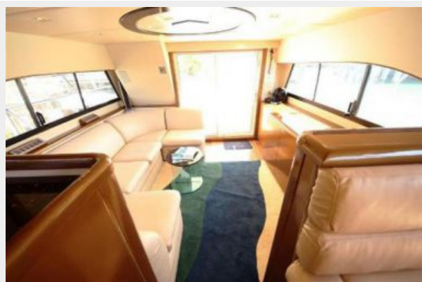
Salon looking aft