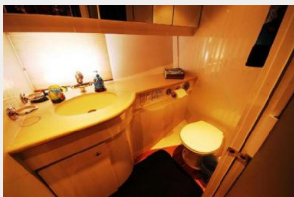
Guest Head w/separate shower