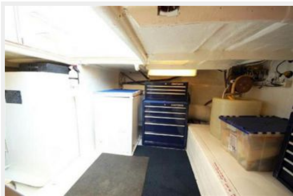
Lazzarette photo 2