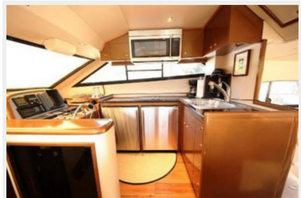
Completely Updated Galley