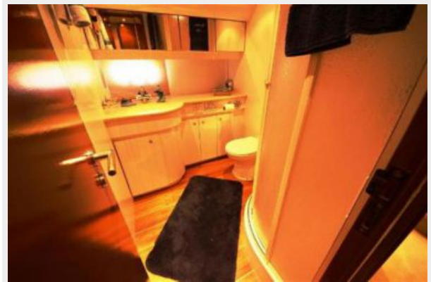
Master Head w/separate shower