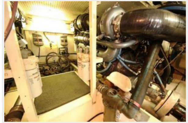
Engine room photo 3