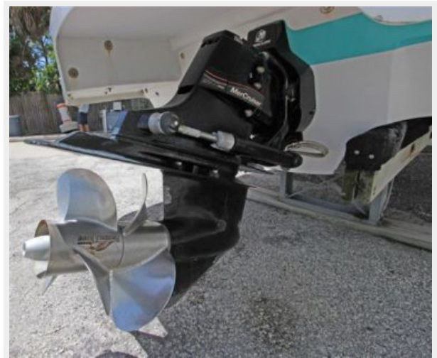
MerCruiser Bravo III Counter Rotating Outdrive