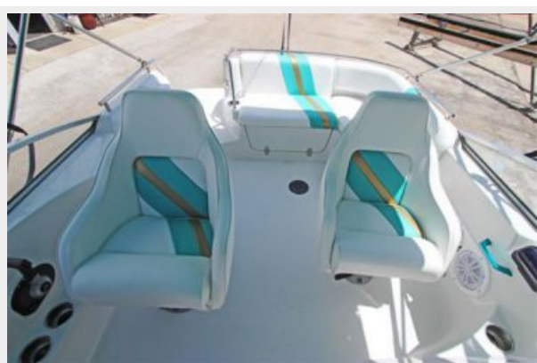
Dual Adjustable Captains Chairs