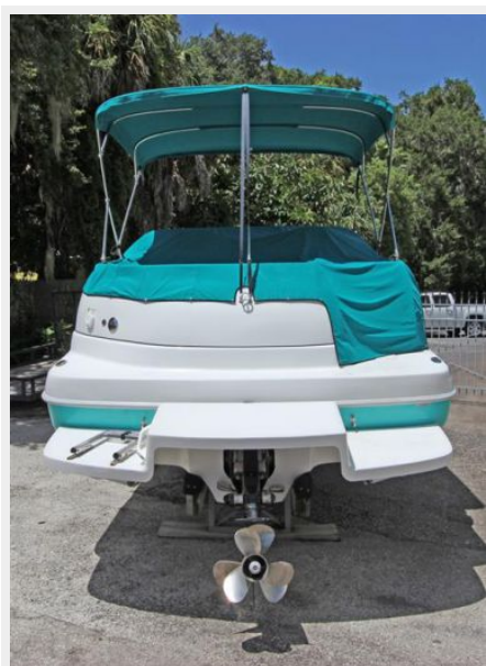
Transom View W/Swim Platform