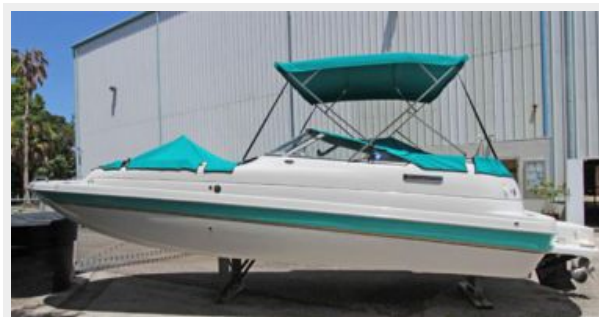
Port View W/Canvas Bimini Top