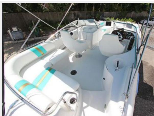
Large Cockpit W/U-Lounger