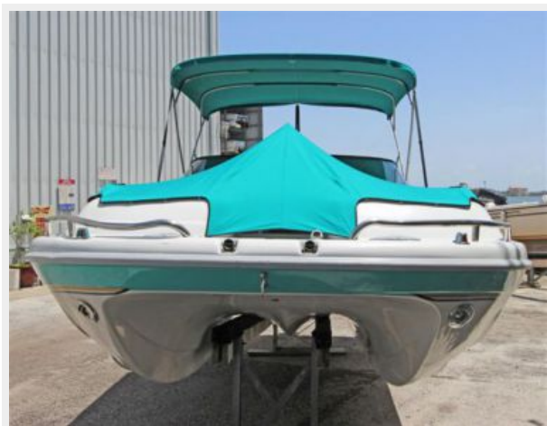
Bow View W/Bow & Cockpit Covers