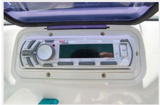
Boss Marine CD/Radio