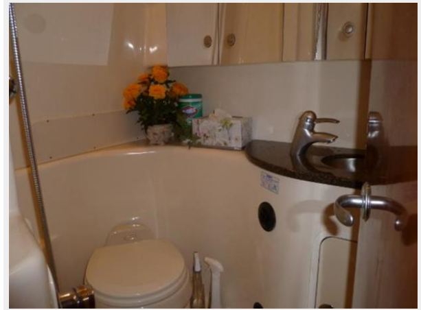
Head with shower enclosure