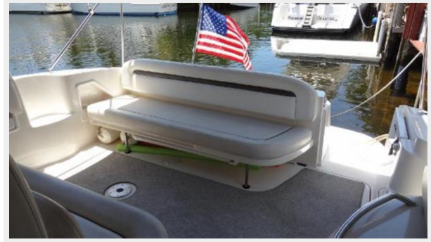
Aft cockpit seating