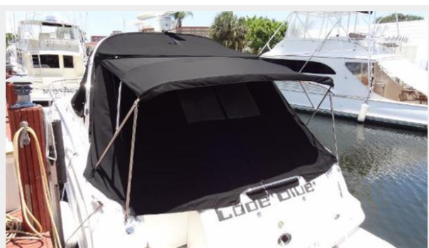
Extended Bimini top and aft enclosure