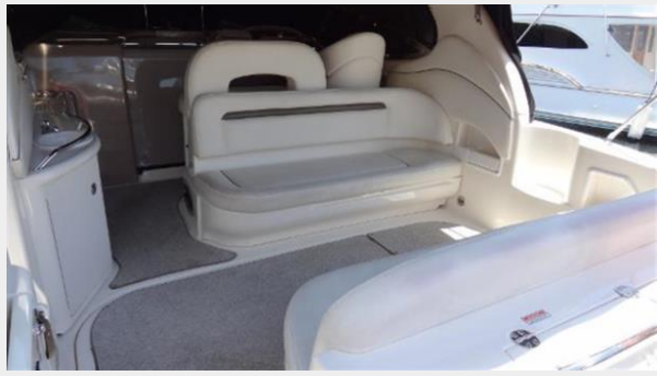
FWD cockpit seating