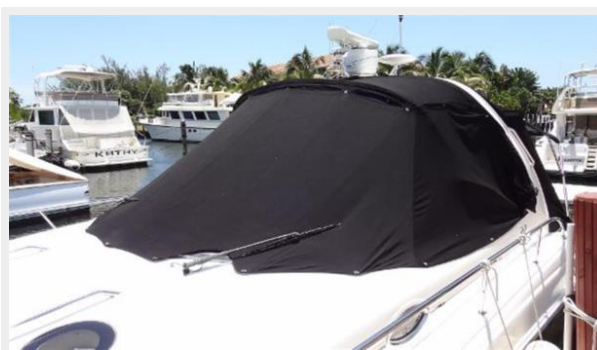
Front windshield enclosure