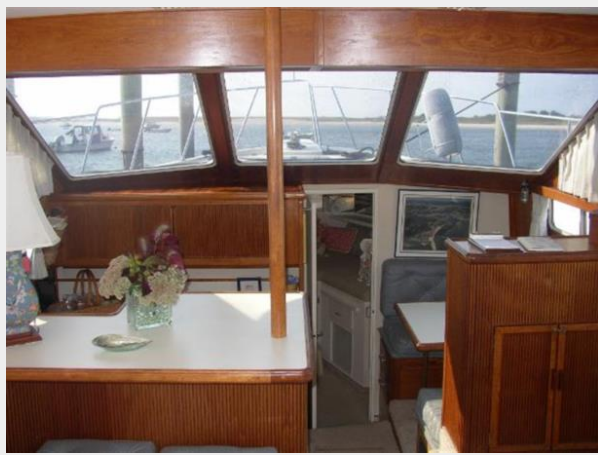
Forward from Salon