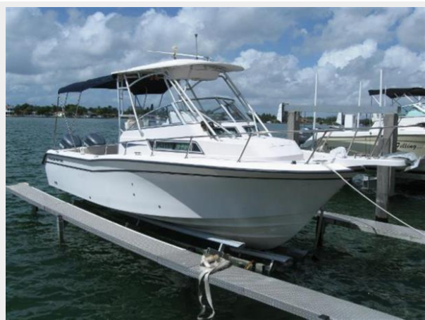
On the Lift