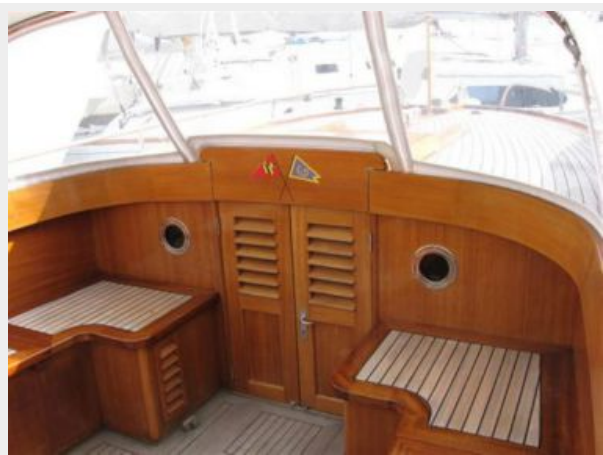
Wing shaped flag staff