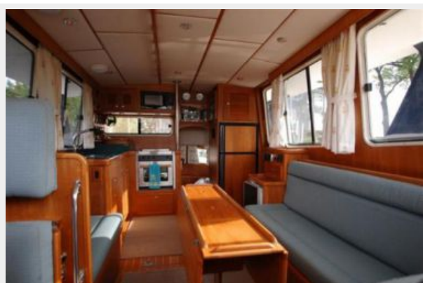
Saloon - facing aft