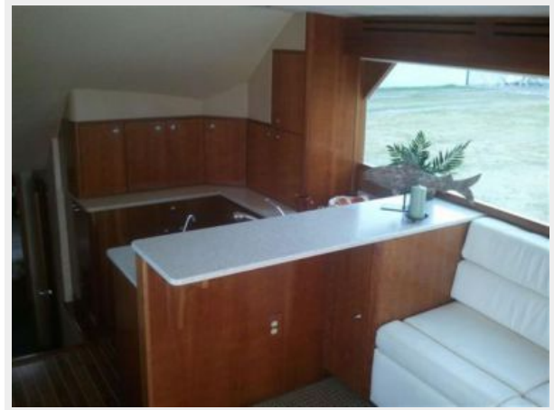
View Stbd and Fwd, ultra leather upholstery and Corian countertops