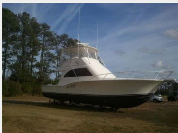
Out of the water view