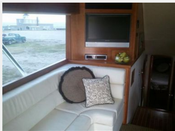
26" Flatscreen, View Port and Fwd