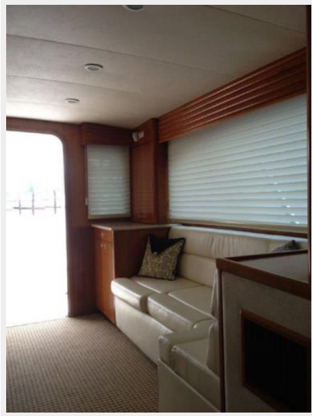
View Port and Aft, custom window treatments