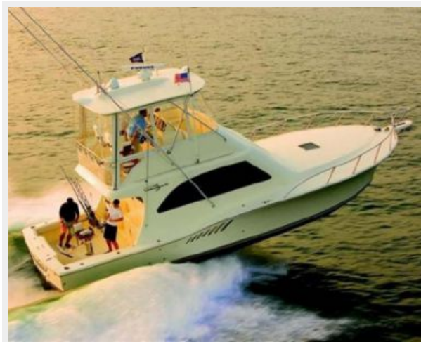
up and running, 30 kt. cruise / 35 kt. WOT