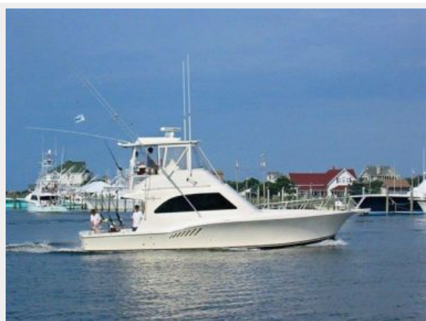
Returning from a day of fishing