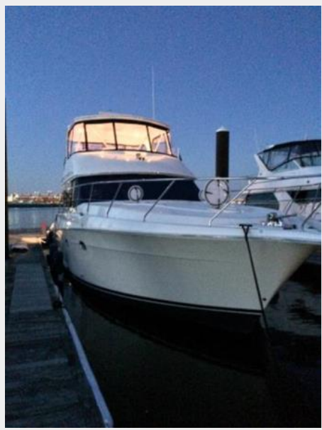
Forward View From Dock