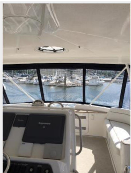
Bridge View Looking Forward