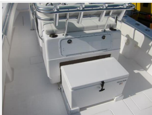
Slid out cooler