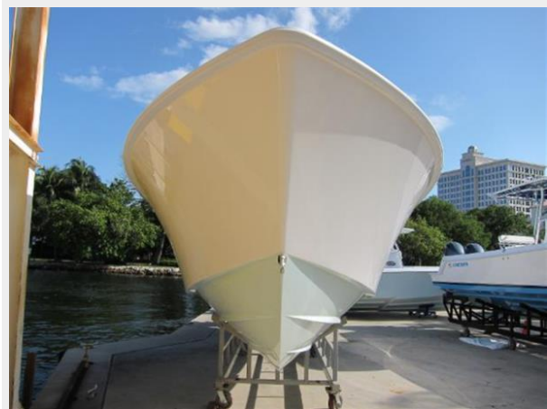
35 Contender ST