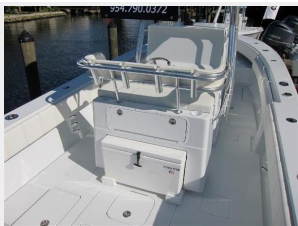
Leaning post w/ pull out cooler