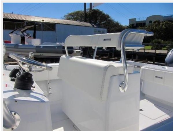
Leaning post w/ backrest bolster