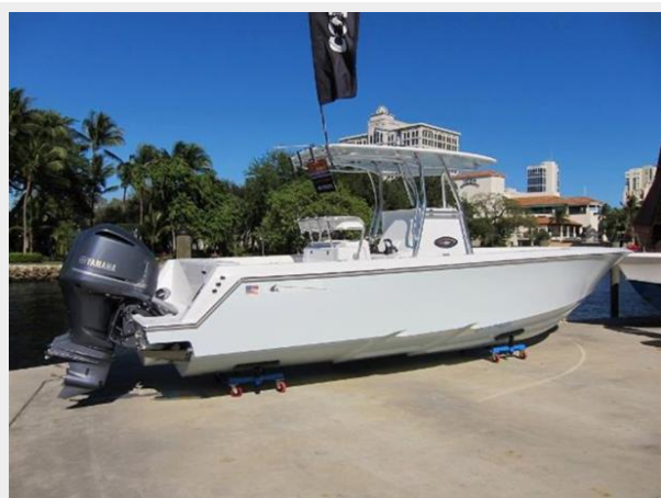
Contender 30 ST