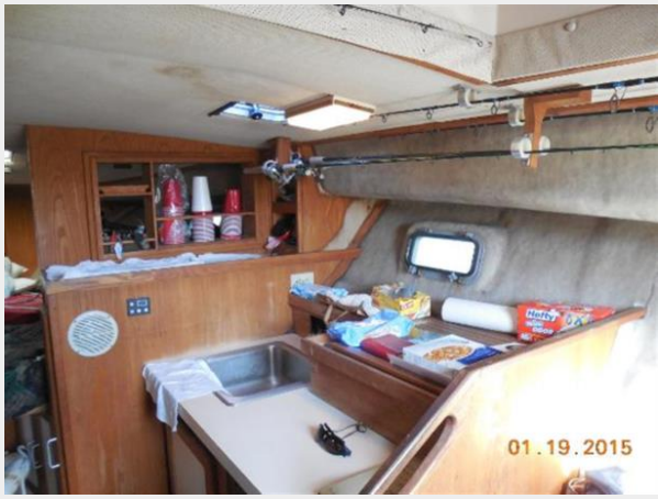
34' Luhrs Open, galley and storage