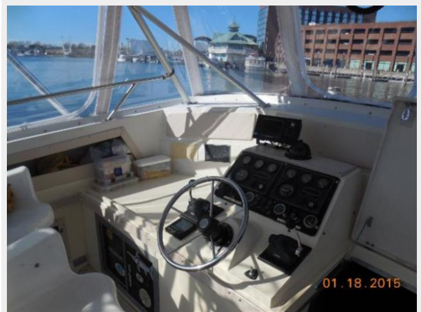
34' Luhrs Open, port side of helm