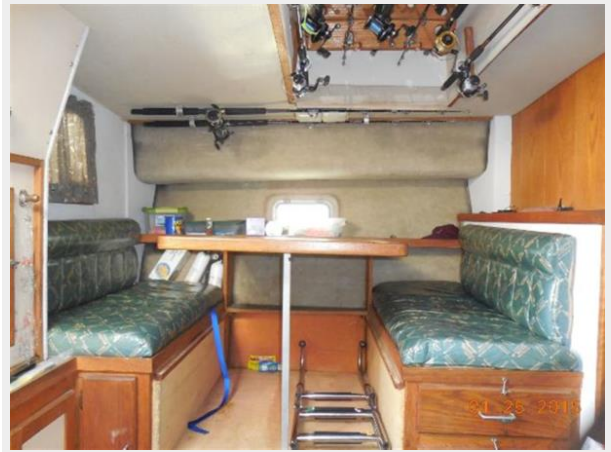
34' Luhrs Open, dinette converts to sleeper