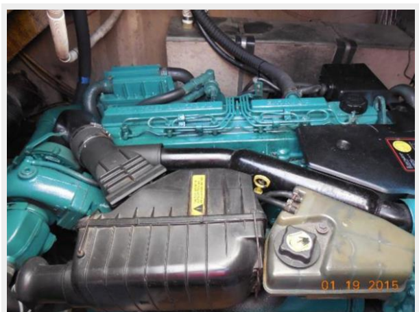
34' Luhrs Open, stbd side engine