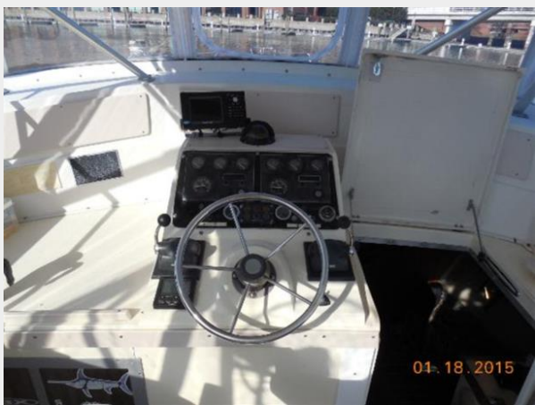
34' Luhrs Open, main helm station