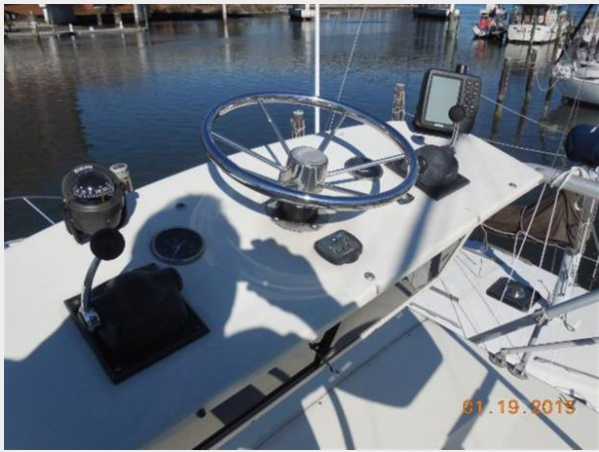
34' Luhrs Open, tower control station