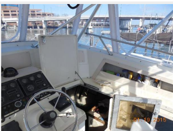
34' Luhrs Open, stbd side of Helm