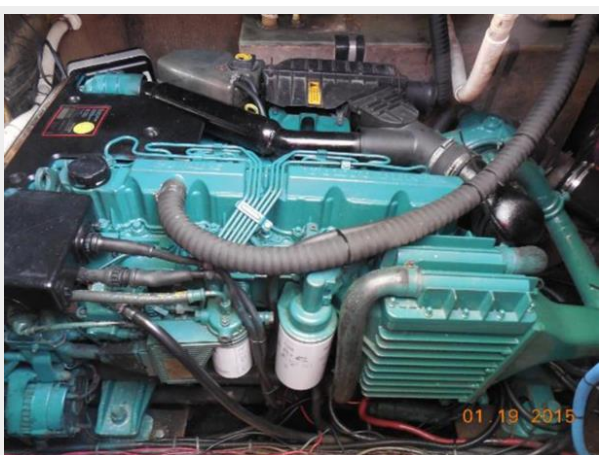
34' Luhrs Open, port side engine