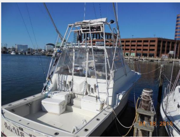
34' Luhrs Open, stbd stern