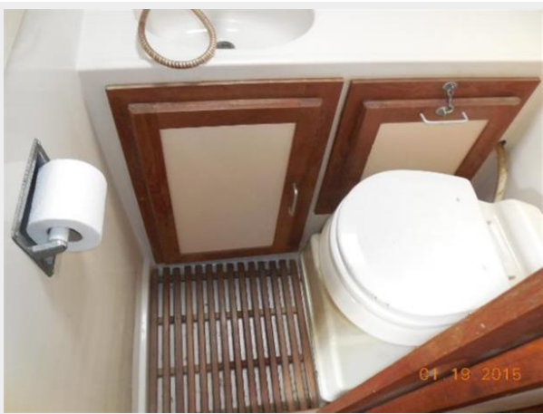
34' Luhrs Open, teak floor in head