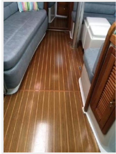
Teak & Holly Sole