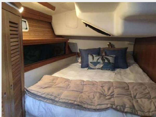
Aft Berth - Starboard