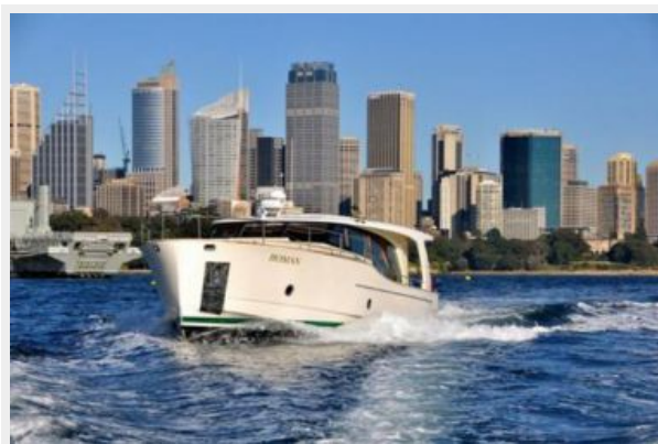
Greenline Hybrid 40