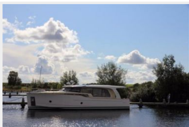
Greenline Hybrid 40