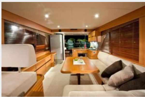
Greenline Hybrid 40 Saloon Seating