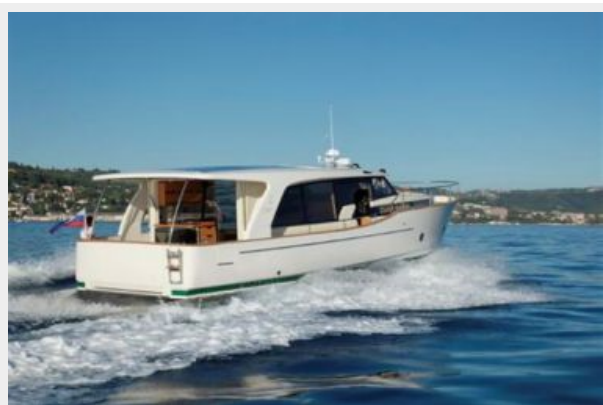
Greenline Hybrid 40 Stern