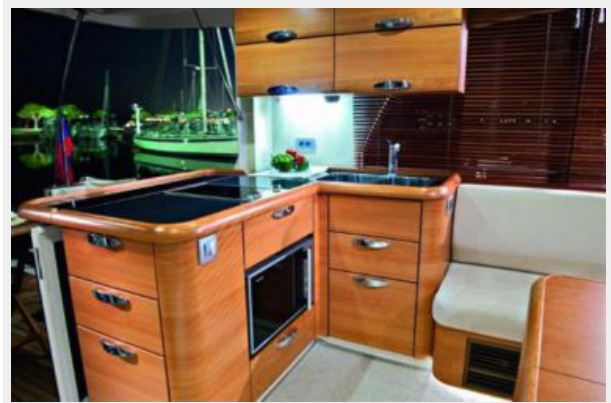
Greenline Hybrid 40 Galley