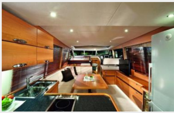
Greenline Hybrid 40 Saloon