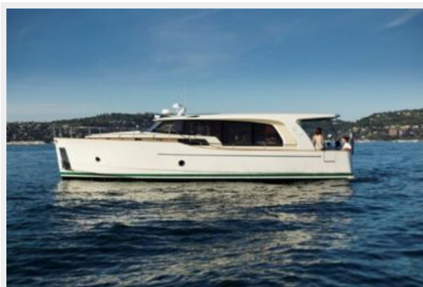
Greenline Hybrid 40 Side View