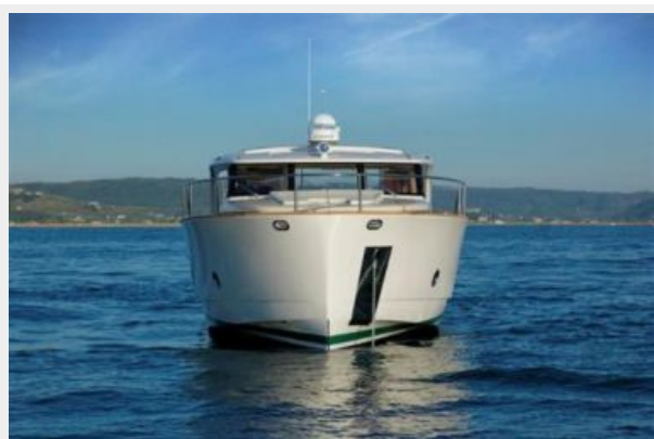
Greenline Hybrid 40 Bow