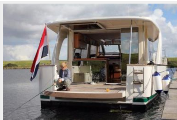
Greenline Hybrid 40 Stern