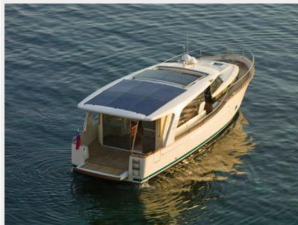
Greenline Hybrid 40 Stern