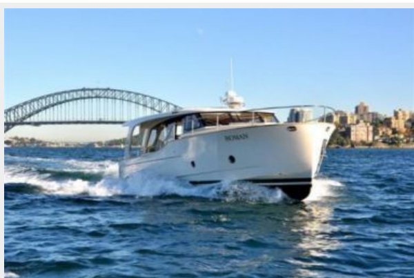
Greenline Hybrid 40 Bow