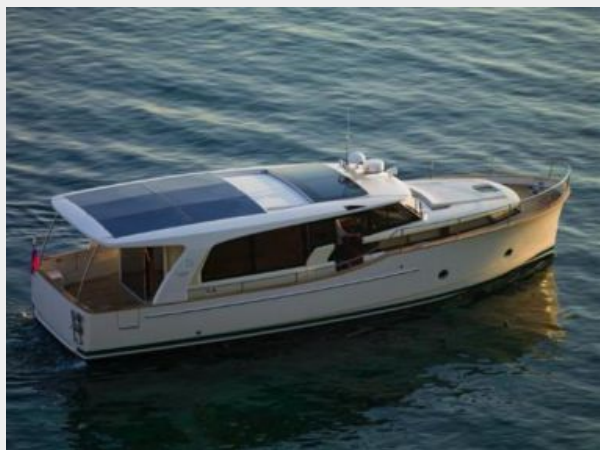
Greenline Hybrid 40