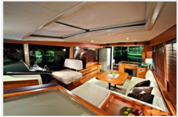
Greenline Hybrid 40 Seating