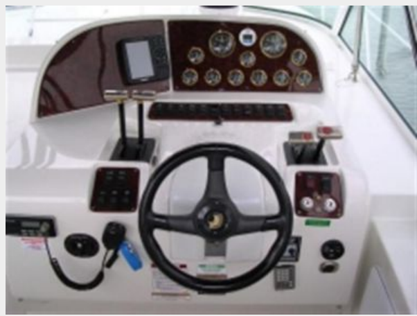
Helm & Companionway covers