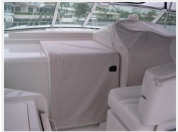
Cockpit Wet Bar