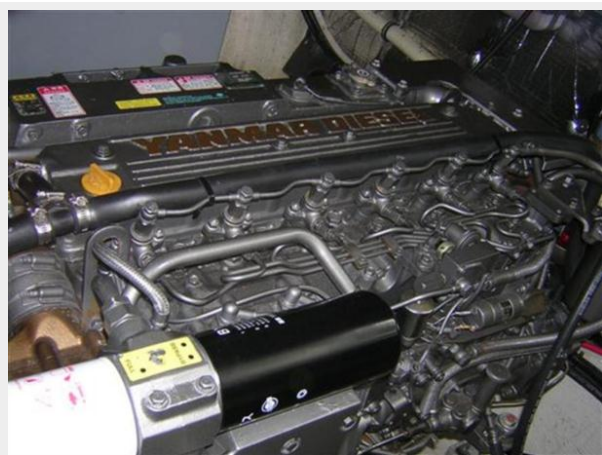
Port Yanmar Diesel