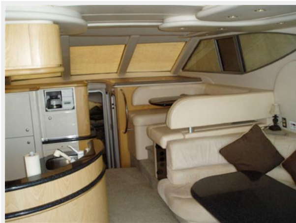
Salon Looking Forward