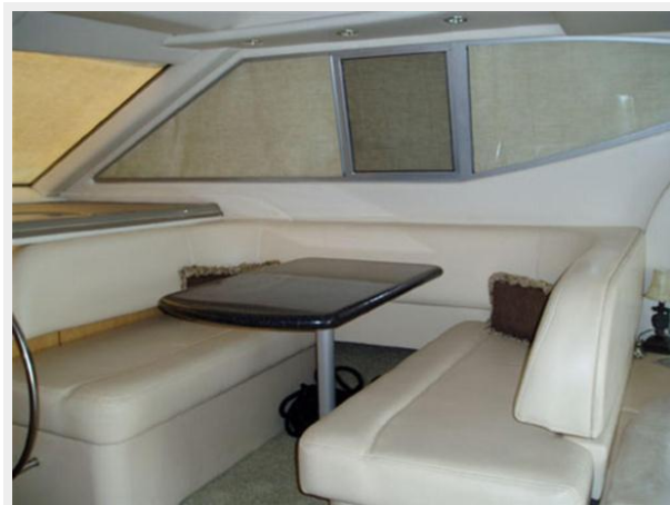
Flybridge Aft Seating