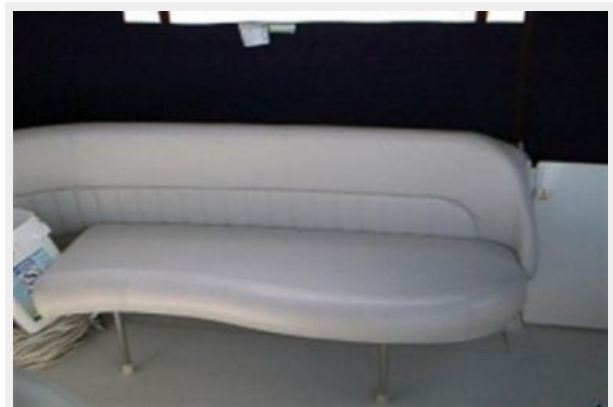
Cockpit Port Side