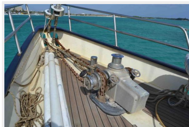
New teak deck