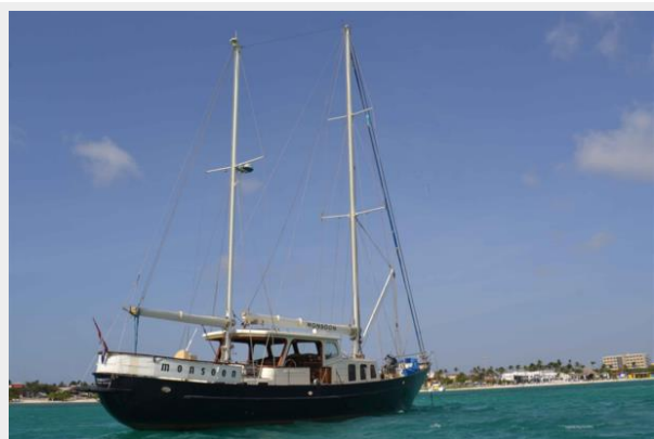
custom motorsailer for sale